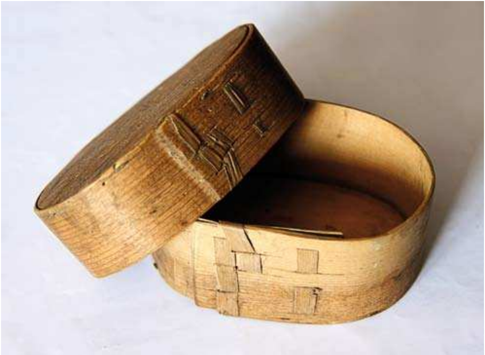
Fig. 1 - Tipica scatola a nastro di legno. Le singole parti del corpo sono incollate in modo tradizionale.

Typical traditional split bendwood box. The individual part of the corpus are stitched in traditional way.